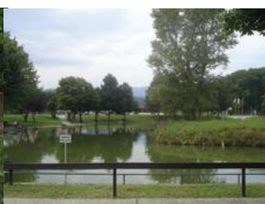
Ribolovno područje za OSI, Jezero „Granešina“

Zagrebačka gora Medvednica popularno je izletišta Zagrepčana, poznatija po nazivu vrha - Sljeme. Na njezinom jugozapadnom obronku, na visini od 593 m nalazi se i Medvedgrad, utvrda sagrađena još u 13. stoljeću, jedan od najvećih burgova u Hrvatskoj. Ranogotička kapelica sv. Filipa i Jakova smještena je na Medvedgradu kao i Oltar Domovine, spomenik hrvatskim braniteljima, palim za vrijeme Domovinskog rata. Od rekreacijskih sadržaja na Sljemenu se nalazi šumska staza „Bliznec“ – prva poučna staza u Hrvatskoj koja je u potpunosti izvedbom i sadržajima prilagođena osobama s invaliditetom.