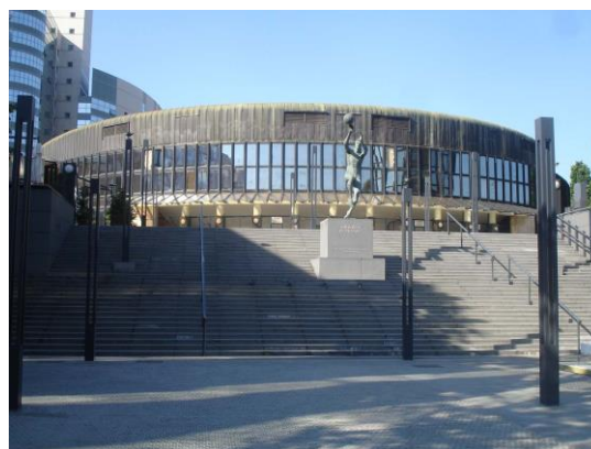
Košarkaški centar „Dražen Petrović“

Zagreb kao tipičan srednjoeuropski grad bogat je kulturnim spomenicima. Povijesne četvrti Gornji grad i Kaptol, te Donji grad smatraju se središtem Zagreba u kojem se nalazi iznimna raznolikost arhitektonskih stilova od baroka pa sve do suvremenih umjetničkih izričaja. Gornji grad ili Gradec predstavlja povijesnu jezgru Zagreba koja je zasnovana u srednjem vijeku i sve do 19. stoljeća činila je, zajedno s