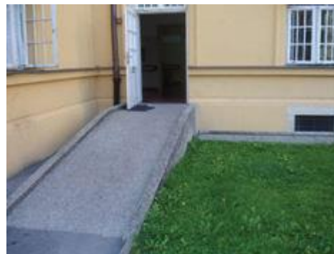
Psihijatrijska bolnica Vrapče

Grad Zagreb je i pravosudno središte Republike Hrvatske, a pravosudne ustanove – Općinski sud u Zagrebu, Općinsko državno odvjetništvo Grada Zagreba i Prekršajni sud u Zagrebu prilagođene su osobama s invaliditetom. Zagreb je oduvijek bio otvoren, gostoljubiv – Grad prijatelj, stoga i održava prijateljsku suradnju s nizom gradova kao što su primjerice: Mainz, Krakow, Bologna, Budimpešta, Beč, London, Sarajevo, Ljubljana, Lisabon, Kyoto i dr.