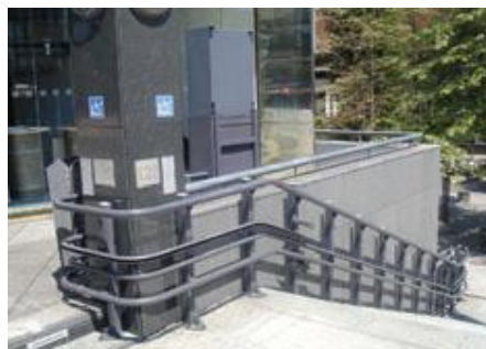
Muzejsko-memorijalni centar „Dražen Petrović“