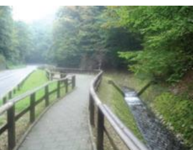
Šumska staza za OSI „Bliznec“