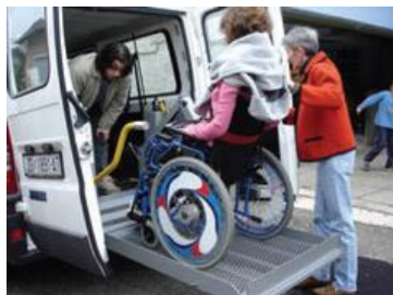
ZET – Odjel za prijevoz OSI