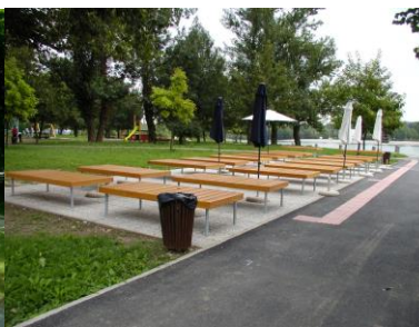
Sunčalište za OSI Jarun