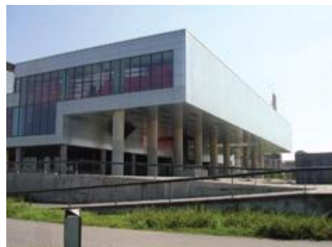
Muzej suvremene umjetnosti

Sveučilište u Zagrebu najstarije je sveučilište s neprekinutim djelovanjem u Hrvatskoj i među najstarijima u Europi, te je 2009. godine proslavilo 340 godina postojanja. Sveučilište u Zagrebu danas čini 29 fakulteta, 3 akademije, jedan interdisciplinarni studij i jedan sveučilišni centar. Od fakultetskih ustanova pristupačnih osobama s invaliditetom samo neke su: Filozofski fakultet, Fakultet političkih znanosti, Tekstilno-tehnološki fakultet, Fakultet političkih znanosti, Edukacijsko-rehabilitacijski fakultet, Učiteljski fakultet, Prirodoslovno-matematički fakultet, Šumarski fakultet, Agronomski fakultet, Tehničko veleučilište, Studentski centar.