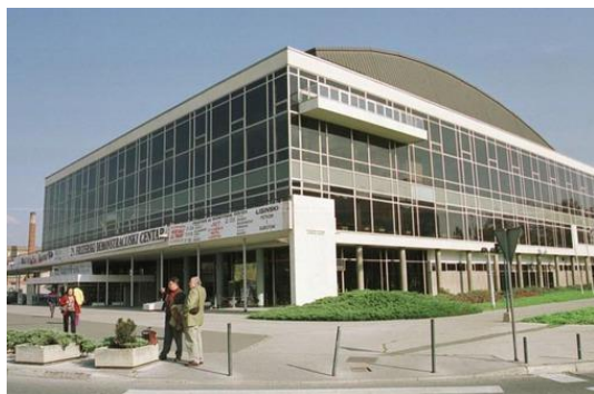
Koncertna dvorana Vatroslava Lisinskog