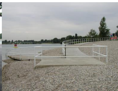
Kupalište za OSI Jarun