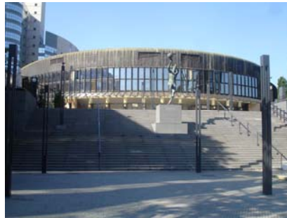
Košarkaški centar „Dražen Petrović“