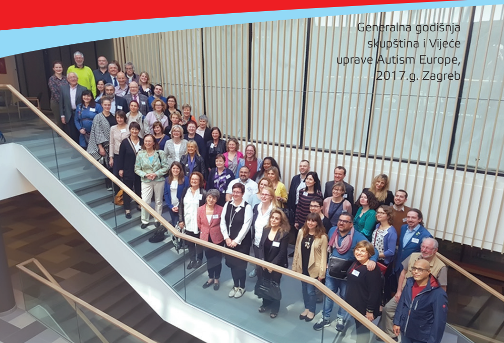
Generalna godišnja skupština i Vijeće uprave Autism Europe, 2017.g. Zagreb

SUZAH djeluje kao Društvo za pomoć djeci i mladeži s autizmom još od 1979. godine, no kao udruga je registrirana u srpnju 1998. godine pod nazivom Udruga za autizam Hrvatske (UZAH) koja u rujnu 2014. godine mijenja ime u Savez udruga za autizam Hrvatske (SUZAH).