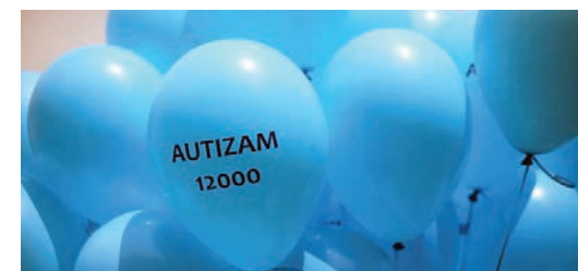
Svjetski dan svjesnosti o autizmu 02.travnja

SUZAH svoje ciljeve ostvaruje kroz umrežavanje, zagovaranje, dijalog i partnerstva, javno djelovanje, informiranje i neformalno obrazovanje, istraživanja i izdavaštvo.