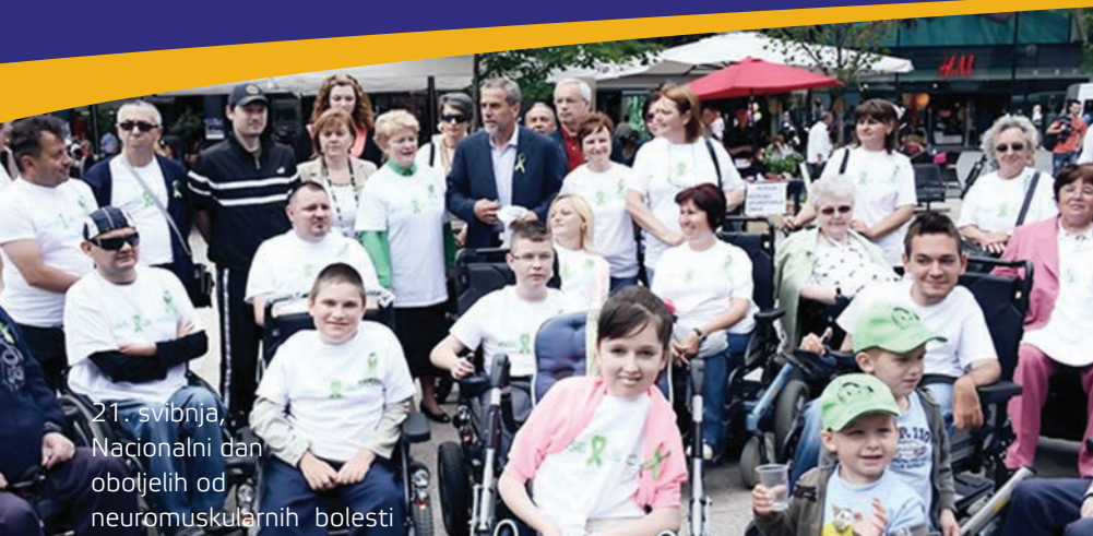
21. svibnja, Nacionalni dan oboljelih od neuromuskularnih bolesti

Savez društava distrofičara Hrvatske – SDDH je nestranačka i ne-profitabilna organizacija, mreža od 28 dobrovoljno udruženih općinskih, gradskih i županijskih udruga koje okupljaju osobe oboljele od mišićne distrofije (MD) i srodnih neuromuskularnih bolesti (NMB) u jedinstvenu organizaciju na području RH radi unapređenja kvalitete njihova življenja i aktivnog sudjelovanja u zajednici.