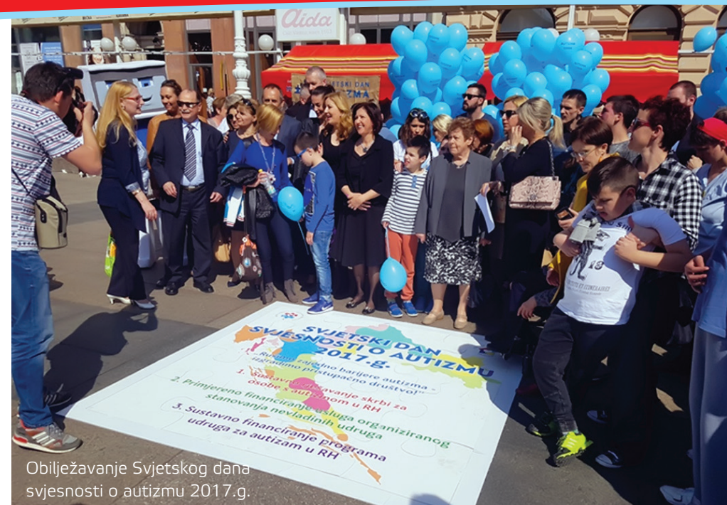
Obilježavanje Svjetskog dana svjesnosti o autizmu 2017.g.

Glavna djelatnost i vizija SUZAH-a i njenih članica jest promicanje statusa i kvalitete življenja osoba s autizmom te poticanje razvoja mreže usluga za osobe s autizmom na cijelom teritoriju RH.