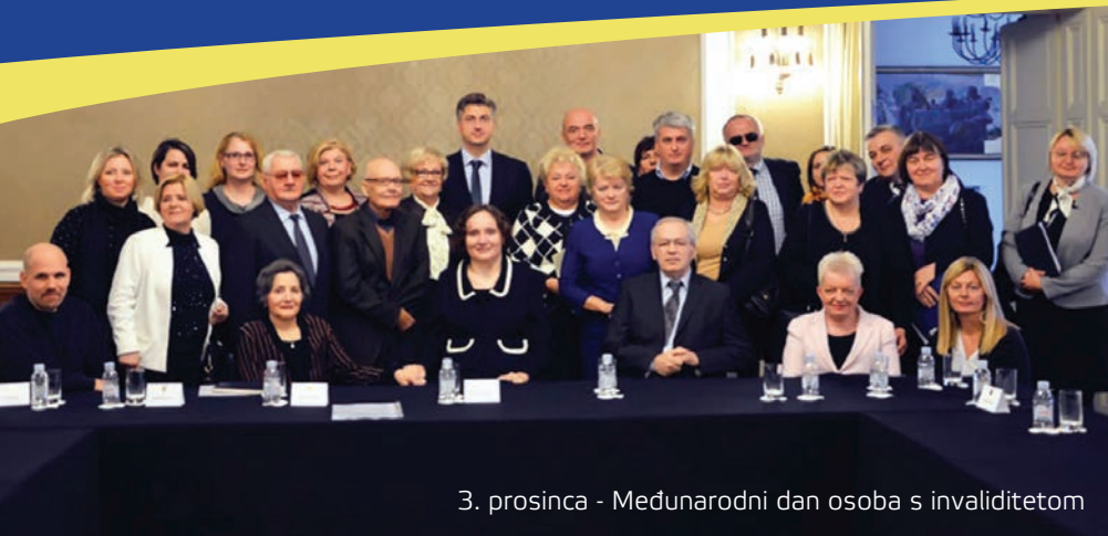
3. prosinca - Međunarodni dan osoba s invaliditetom