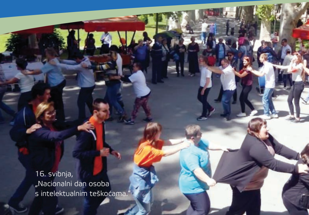
16. svibnja, „Nacionalni dan osoba s intelektualnim teškoćama.“

Hrvatski savez udruga osoba s intelektualnim teškoćama osnovan je u Zagrebu 1957. godine i od tada aktivno djeluje kao krovna, nevladina i neprofitna mreža udruga članica sa sjedištem na adresi Ilica 113, Zagreb. Savez obuhvaća 32 temeljne udruge iz cijele Republike Hrvatske s više od 10.000 članova u čiju korist djeluje. Savez je od svojih početaka aktivan na međunarodnoj sceni kao član globalne organizacije za pitanja intelektualnih teškoća Inclusion International, a od 2006. godine član je europske podružnice Inclusion Internationala, Inclusion Europe.